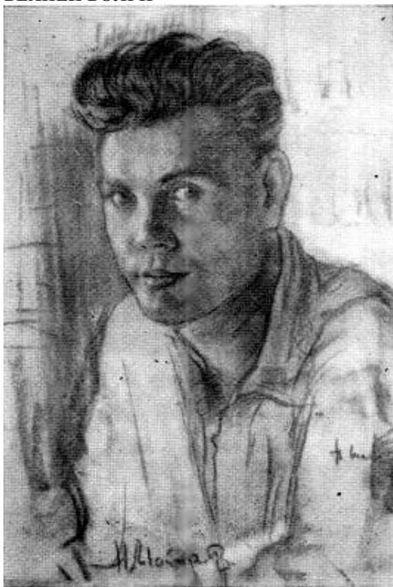
Рисунок художника Н. Шиберстова 1939 г.